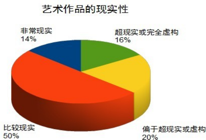
图二：艺术作品的现实性

其二，六成受访者所选的艺术形象所属作品的现实程度为非常现实或比较现实，多于超现实或虚构的作品(详见图二)。